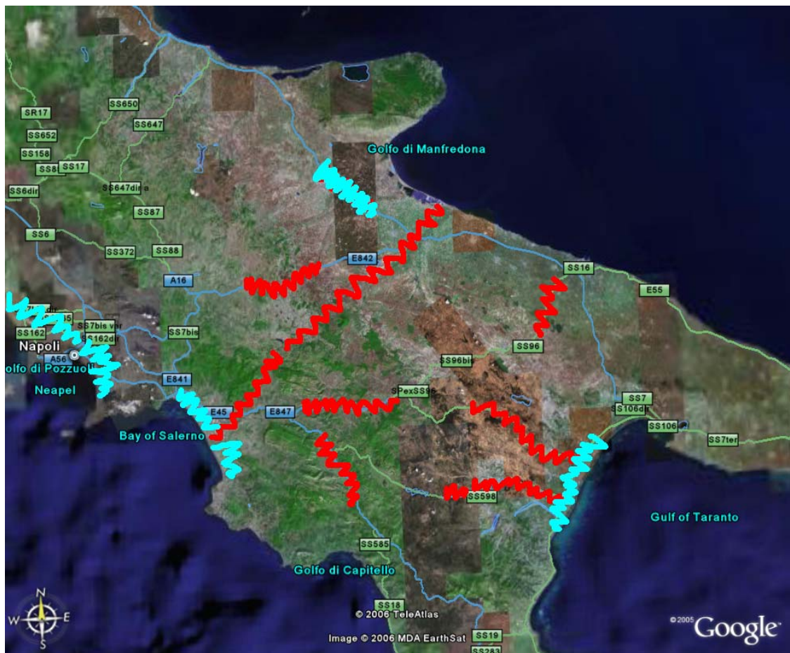
Le frontiere per documento Strategico del Mezzogiorno 2007/20013? (Mauro Iacoviello- Agenzia Territoriale per l'Ambiente NBO)